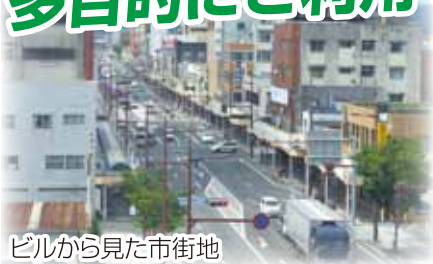
ビルから見た市街地

会議・セミナー・研修・商談・ イベント会場・面接会場・講習会など 多目的にご利用できます。(軽食可)